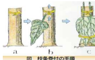
図 枝条巻付の手順