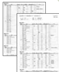
果樹共済引受データチェック